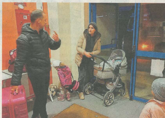
Plusieurs enfants en bas âge font partie des réfugiés ukrainiens arrivés à Bretteville-sur-Odon.